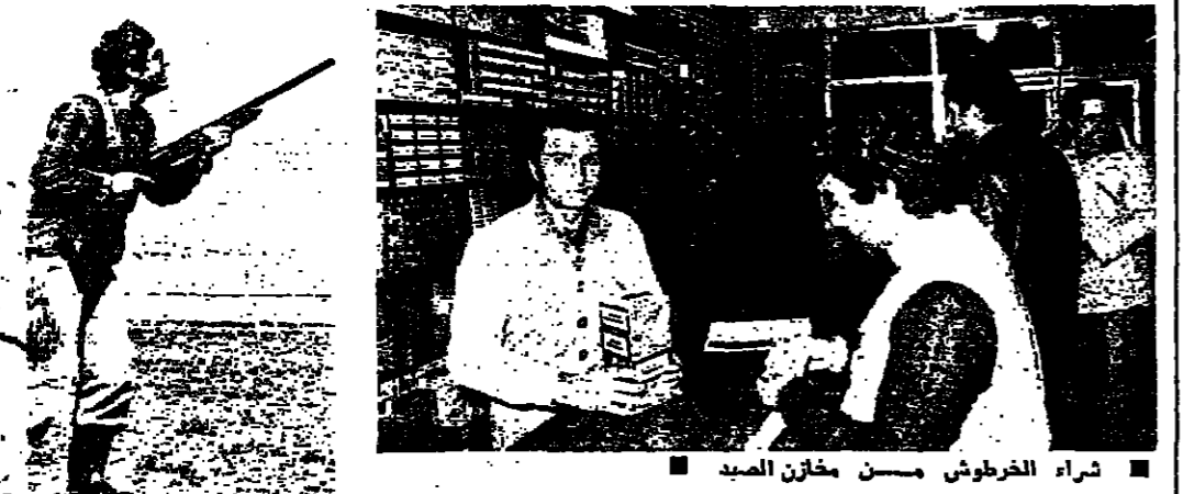
انتظار مرور المطوق

طرقت البقاع التي ظلت طمس السنين الماضية مهجورة ، في اليوم ترصد سيارات صيادي المطوق الذين يقصدون سهل البقاع ، في هذه الايام من كل سنة ، صيدا سيد نوب . وقد شهدت طرقت البقاع ، في نهاية الاسبوع ، ازدهارا شديدا وامتدادت مقاهي شتورا بالرواد جازوا من كل سنة ، اما لادارة صيد هوية الصيد في سهل البقاع الذي عادت مختلفات التطوير تنتقل بين اصحاب ان يعد ان هدات اصوات الادهاء والتغليب . والطرف الاخر الذي يجذب الصياد ويربهم ، قبل ان ينتموا الى الاغلب .